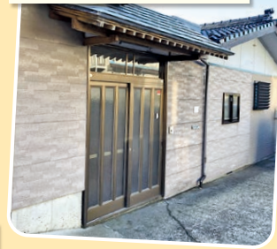
グループホーム そら