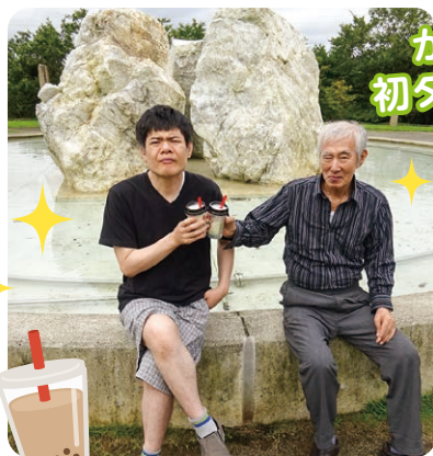
かんぱ〜い! 初タピオカ記念日