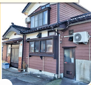
グループホーム 大和川