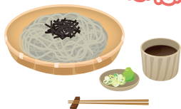
手打ちそばは格別!

新型コロナウイルス感染症の影響により、なかなか外食は出来ませんでしたが、美味しいものをお持ち帰りで楽しみました。