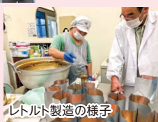
レトルト製造の様子