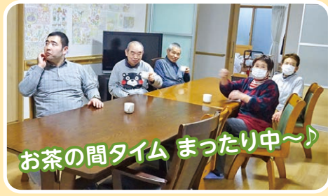
お茶の間タイム まったり中〜♪