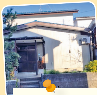
グループホーム 蓮台寺